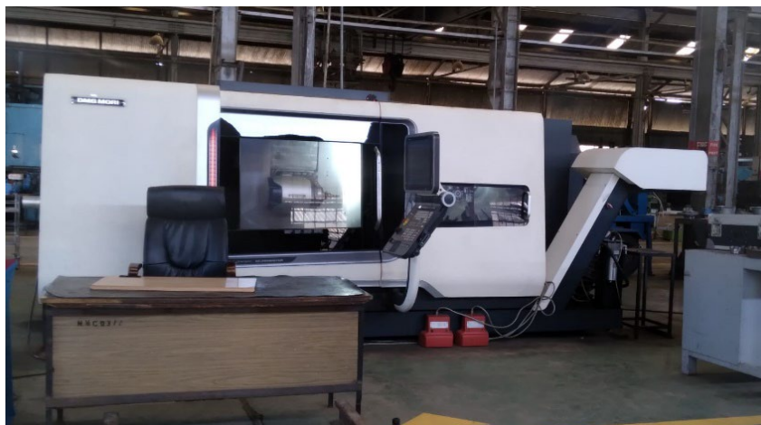
写真: Numerical Machining Complex で使用されている DMG 森精機の加工機

製造した企業としても知られる。同様の事業を営む企業としては、Stealstone、East African Foundry workers、Techno Stealなどが挙げられる。