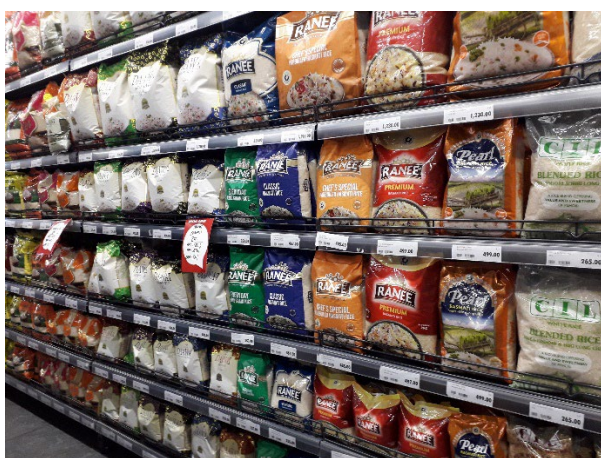
写真:穀物小売店の店頭。Mwea と書かれているのが国産米