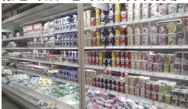
写真:ケニアのスーパーマーケットにおける牛乳、ヨーグルト・ヨーグルトドリンク売り場 写真:ラベル・印刷タイプ別ヨーグルト・ヨーグルトドリンクの容器

容器がほぼ輸入で賄われているような他のアフリカの国と比べると、ケニアの容器自給率は高いが、まだ手に入りづらいものもある。たとえば汎用的なものではないシャンプーのノズルなどが手に入りづらいときは、中国の越境 e コマースであるアリババなどを通じて購入することもあるという。