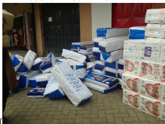
写真:ケニアで売られるユニ・チャームのおむつ Baby Joy

写真:伝統的小売店に Softcare が届いたところ。この店舗では一度にこの数量を発注する